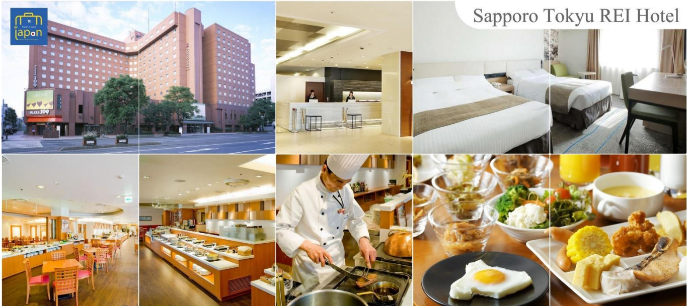
Sapporo Tokyu REI Hotel

อิสระช้อปปิ้ง ย่านซุซุกิโนะ (Susukino) นับเป็นย่านที่เต็มไปด้วยแหล่งบันเทิงที่โด่งดังมากที่สุดของเมืองซัปโปโร (Sapporo) อีกทั้งยังเรียกได้ว่าเป็นย่านบันเทิงที่ใหญ่ที่สุดในทางตอนเหนือของญี่ปุ่นทีเดียวละค่ะ บอกเลยว่าอยากมาบันเทิงใจยามค่ำคืนสัมผัสไลฟ์สไตล์แบบคนญี่ปุ่นแท้ๆ ต้องมาที่นี่ให้ได้เลยละค่ะ เพราะเต็มไปด้วยร้านค้า บาร์ ร้านอาหาร ร้านคาราโอเกะ และตู้ปาจิงโกะ รวมกว่า 4,000 ร้าน บางร้านนี้เปิดจนถึงเที่ยงเที่ยงคืน