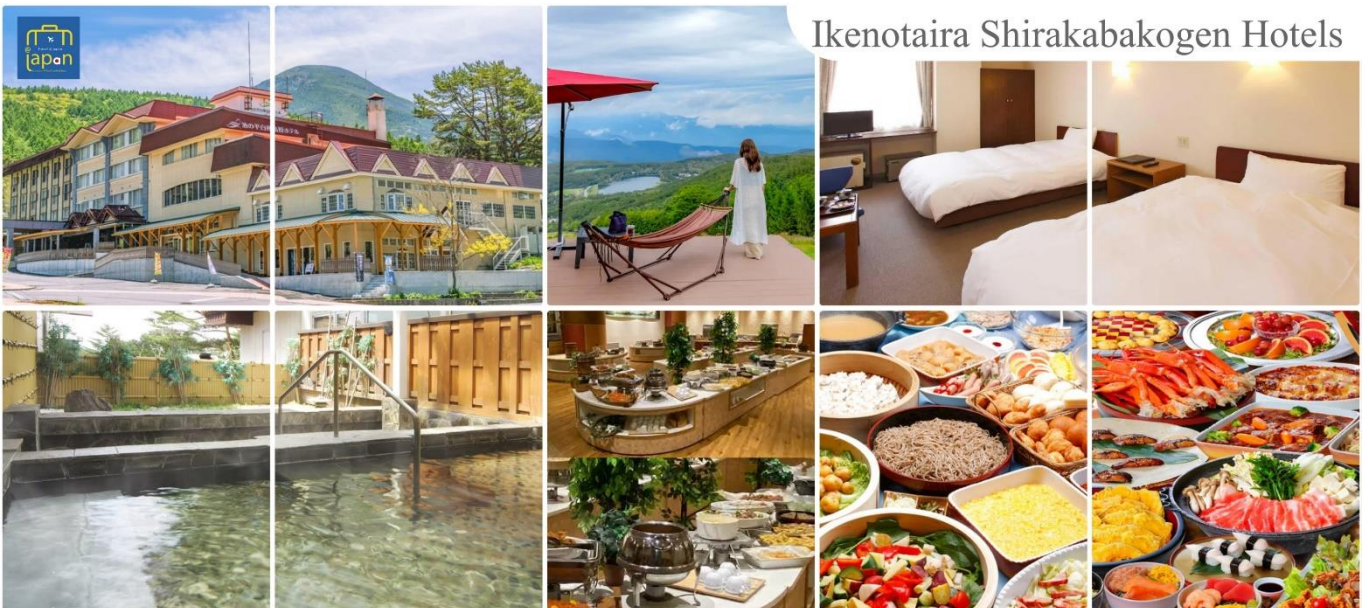
Ikenotaira Shirakabakogen Hotels

หลังอาหารให้ท่านได้ผ่อนคลายกับการแช่น้ำแร่ธรรมชาติ เชื่อว่าถ้าได้แช่น้ำแร่แล้ว จะทำให้ ผิวพรรณสวยงามและช่วยให้ระบบหมุนเวียนโลหิตดีขึ้น