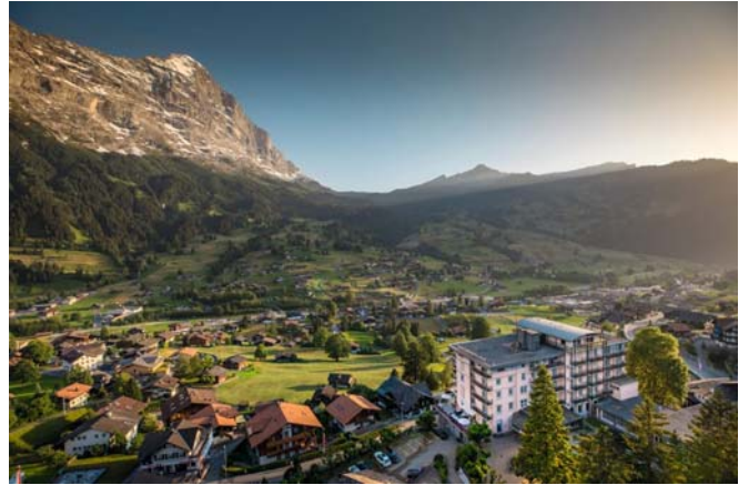
นำท่านเข้าสู่โรงแรมที่พัก SUNSTAR หรือระดับเดียวกัน (2 คืน)